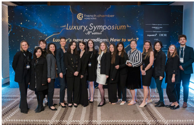
Chambre de commerce et d'industrie française à Hong Kong